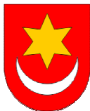
Grad Sveti Ivan Zelina