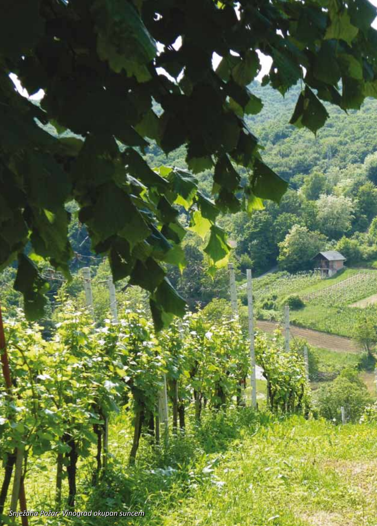
Snježana Požar: Vinograd okupan suncem