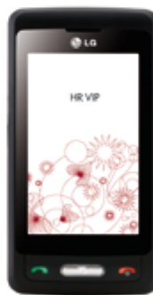
LG KP502 Cookie