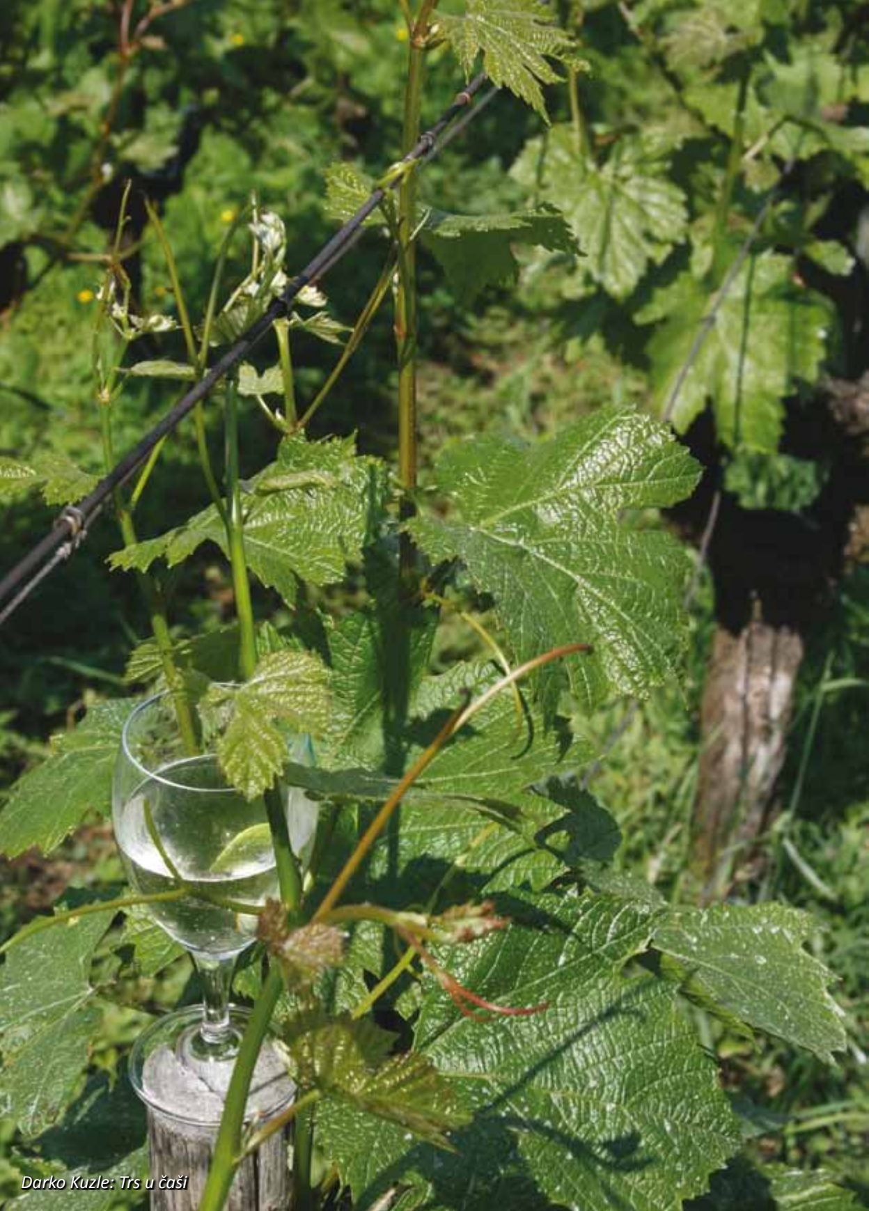
Darko Kuzle: Trs u čaši