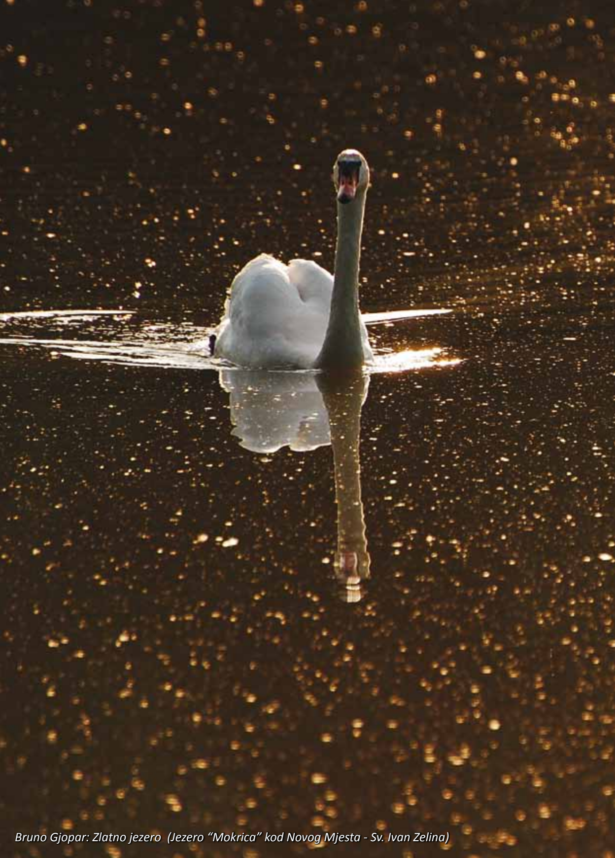
Bruno Gjopar: Zlatno jezero (Jezero "Mokrica" kod Novog Mjesta - Sv. Ivan Zelina)