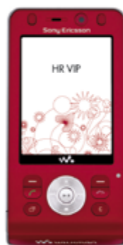
Vodafone live! Sony Ericsson W910i

Uz atraktivne mobitele i mjesečnu naknadu već od 100 kn