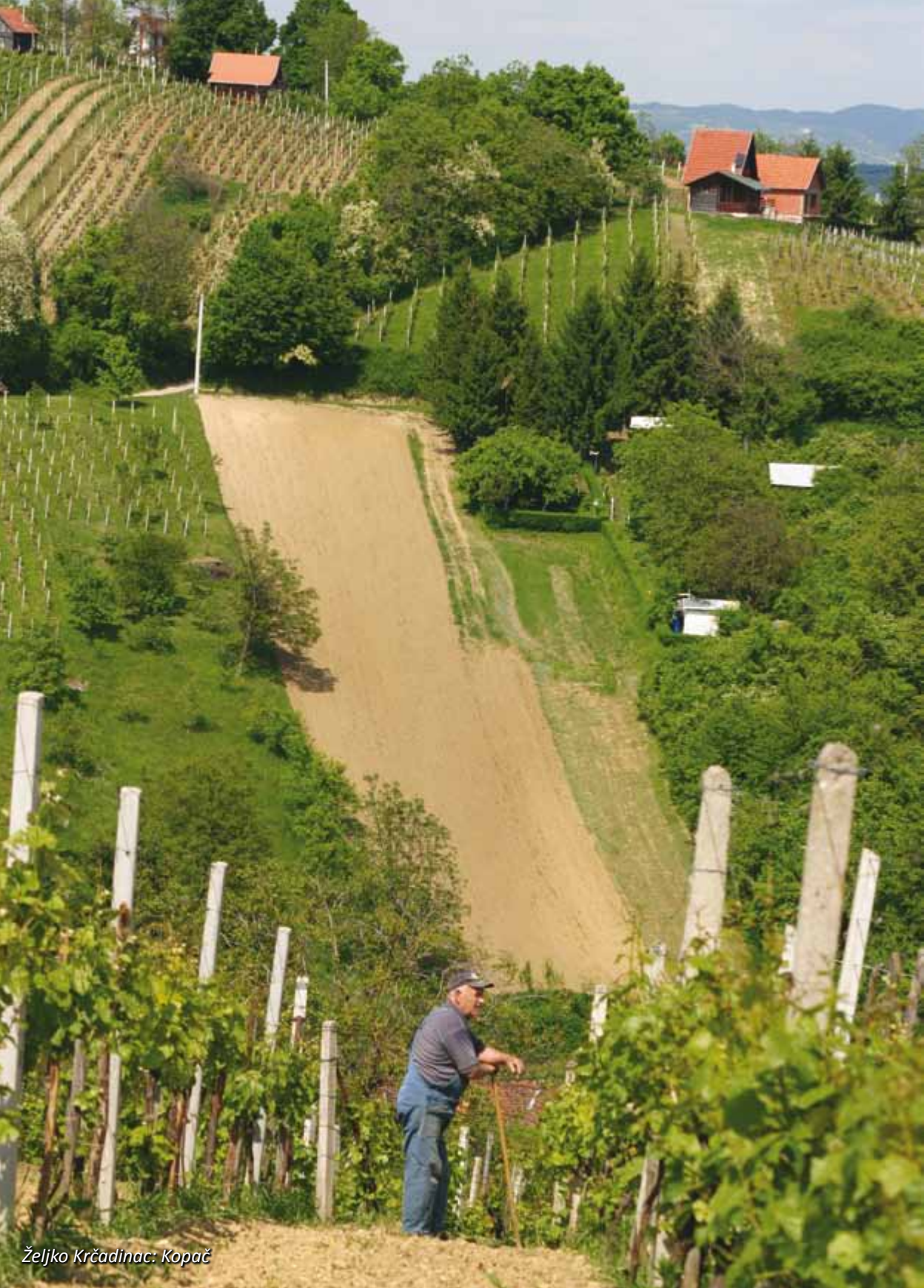
Željko Krčadinac: Kopač