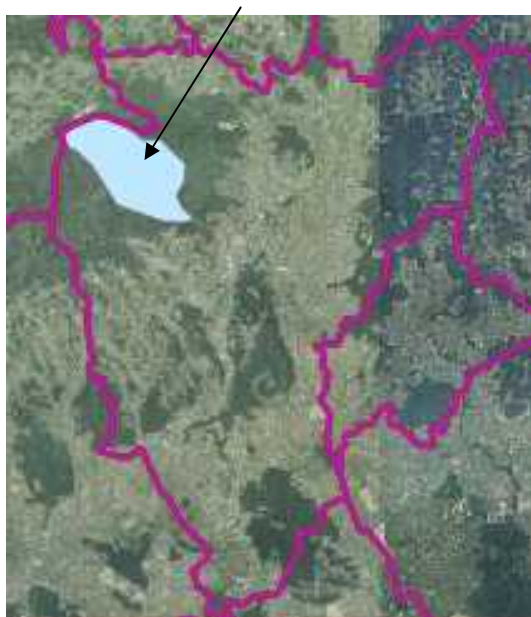
Zelinska glava u odnosu na granice Grada