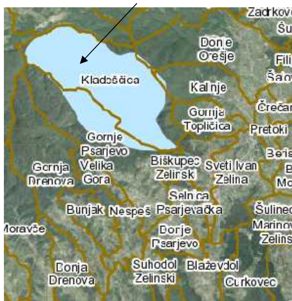
Slika 2 - Zaštićena područja prirode na području Grada Svetog Ivana Zeline