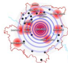
Tablica 3. Lokalni projekti (tip 1) prema strateškim temama i distribuciji po općinama i gradovima Urbane aglomeracije Zagreb